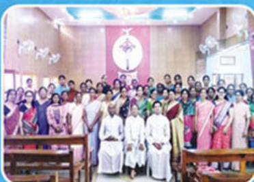
Mahila Divas, Aligarh