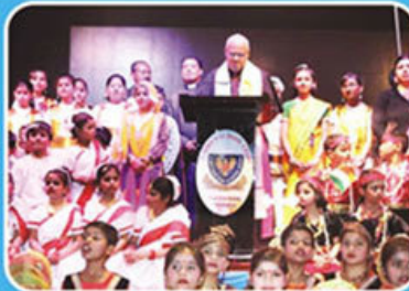
Annual Day, St. John's, UPSIDC