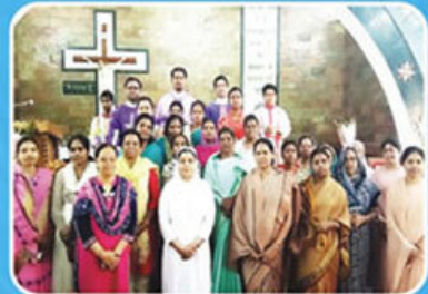
Mahila Divas, St. John's, Firozabad