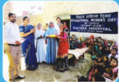
Mahila Divas, Fatima Hospital