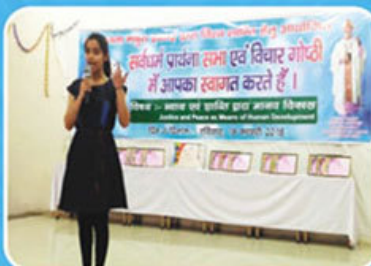
Sadbhavana, Prayer Meetings & Symposium at Mathura (18 Feb) & Aligarh (25 Feb)