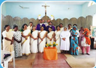
Mahila Divas, Kosikalan, Mathura