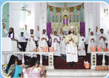
O Come, Let us Adore Him!