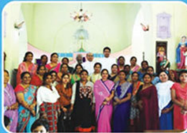
Mahila Divas, Holy Family Church, Tundla