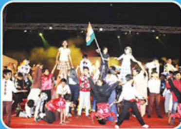
Annual Day, St. John Paul School