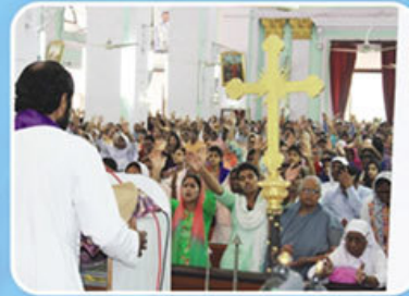
Cathedral of the Immaculate Conception, Agra (8-11 Feb, 2018)