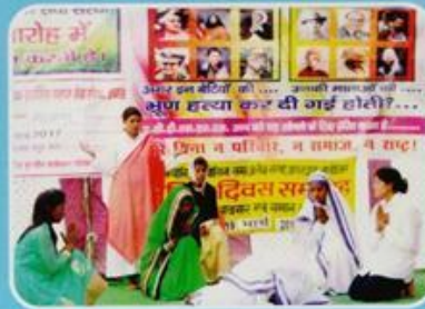
International Women's Day Celebrations, ACDSSS