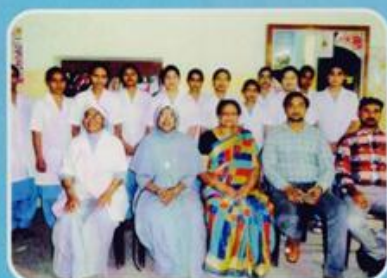
Farewell at Fatima Hospital