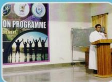
Inaugural Ceremony, 36th LOP, Kotdwar, 18 May 2017