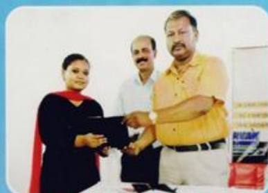
Career Guidance, ICYM, 7 May 2017