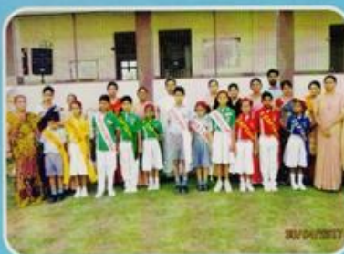
Students' Union, JP School, Fatehabad