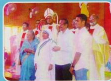
S.Jubilee at Aligarh