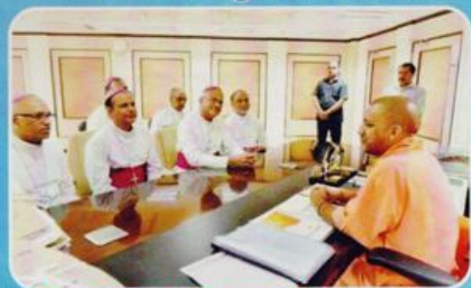
Agra Regional Bishops with Hon'ble CM (UP)